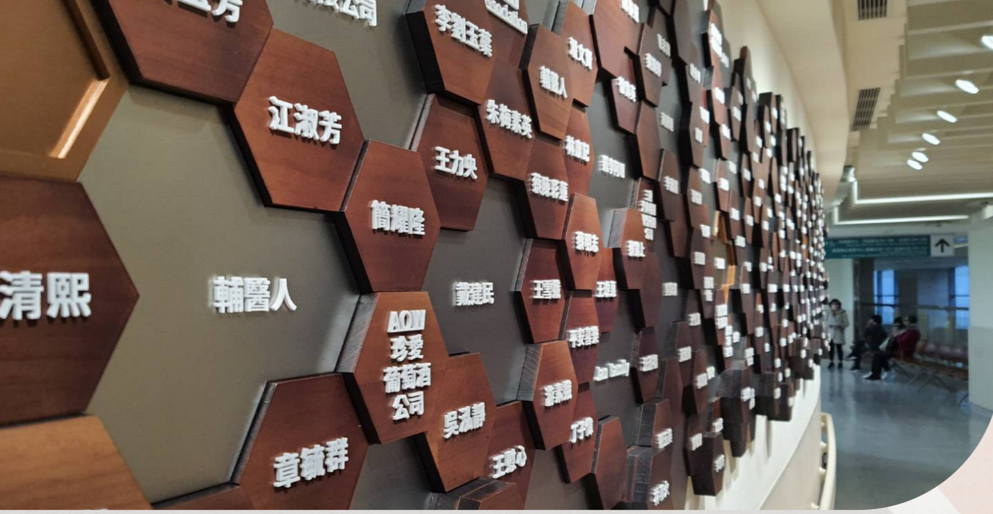
▲ 天橋捐款銘版已全數製作完成，歡迎捐款恩人蒞臨參觀