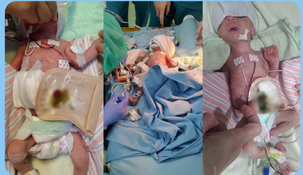
▲ 早產兒因壞死性腸炎，伴隨著腸穿孔併腹膜炎，經手術處理順利脫離危險