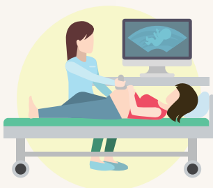
高危險妊娠及 新生兒醫療