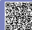
劉副院長 訪談影片

我也感謝社區醫學部同事，他們一班班的去做，第一班已經在去年畢業，第二班即將在四月開始，一次培養大約 30-50 位照服員，這些都是我們種子，目前也建立了橘色通道，和長照機構簽約配合，只要有問題，阿波羅計畫就會再次出現!