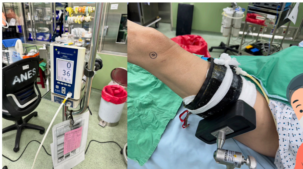
▲ 開刀房手術眾多，止血機需求量大、調度頻繁，以至於開刀房之間多了等待的時間...